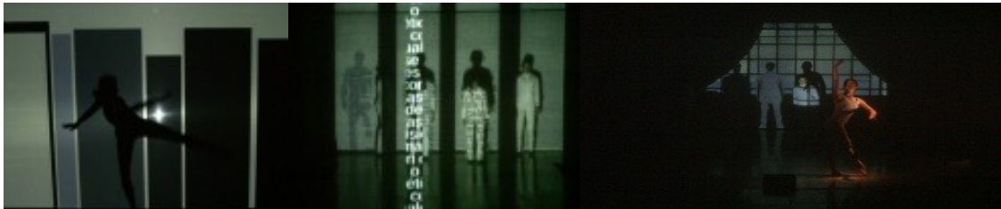
Argumentos a favor de la oscuridad